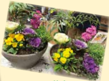
2回目の教室でレベルアップしたかも!!