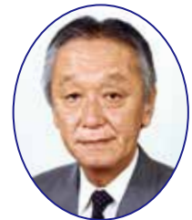
志摩市国際交流協会 会長