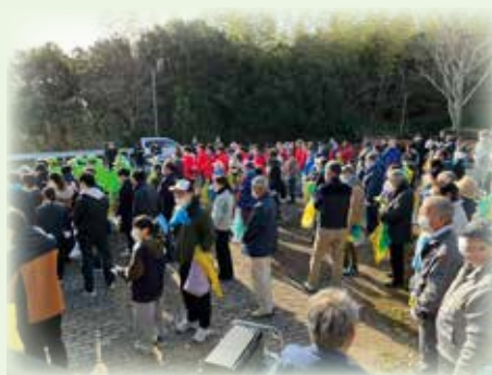
阿児アリーナ前に集合