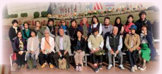
リトルワールド入り口前

世界各国の民族文化にふれ、志摩市国際交流協会の名にふさわしいプチ世界旅行気分を味わえた充実した秋の一日となりました。