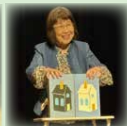
小保方会員(独唱・マジック)