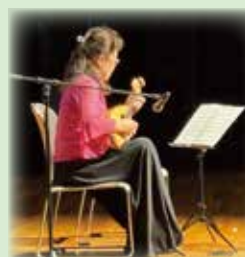
岡宗会員(マンドリン)